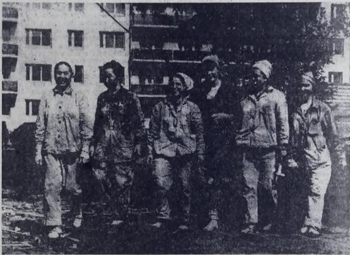
Хорошо ведет отделочные работы на объектах жилья и соцкультбыта коллектив второго участка СМУ-3. Три Красных знамени, полученных участком на вечное хранение, — свидетельства его трудовых заслуг. В бригадах участка широко внедряются передовые методы ор-