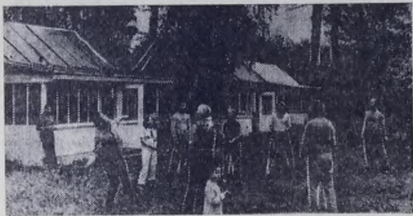
В доме отдыха ЖКУ «Ручеек».