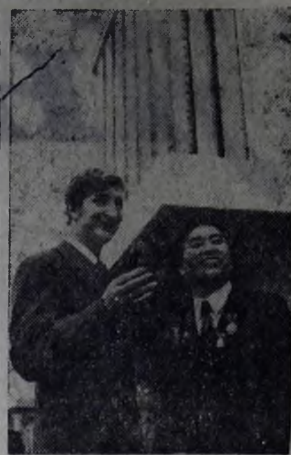
МНР. Сотни семей улан-баторцев справили недавно новоселье в домах, построенных коллективом домостроительного комбината.

Л. ТРЕТЬЯКОВ, секретарь партбюро МСУ-42.