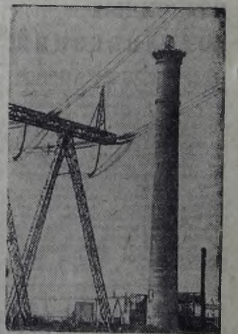
МОСКВА. Гордятся москвичи бесчисленными подъемными кранами новостроек в разных концах нашей необъятной столицы.

На снимке: уникальная, почти двухсотметровая бетонная труба для ТЭЦ-25, сооружаемая московскими строителями совместно с коллегами из ГДР.