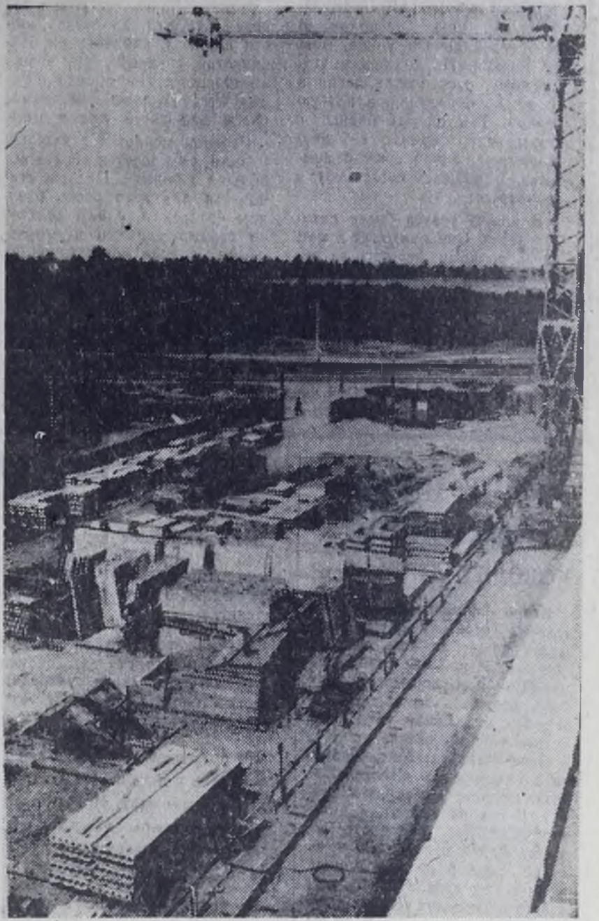
Так выглядит строительная площадка на доме № 7а 11 микрорайона.

Одним из самых эффективных средств повышения производительности труда является обучение рабочих смежной профессии, забота о росте их квалификации. При внимательном и вдумчивом подходе к этому резервы можно всегда найти.