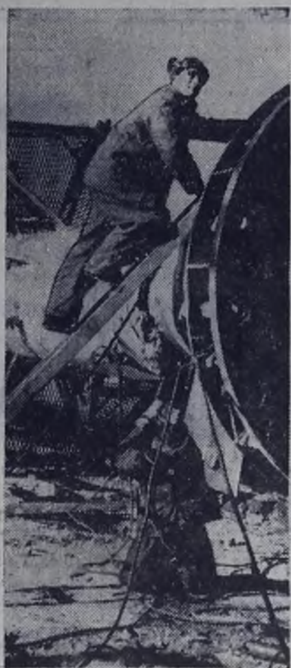
На главном пусковом объекте определяющего года — комплексе по производству этилена-пропилена. Идет монтаж колонн.

Партийные организации стройки накопили богатый опыт агитационно-массовой работы с населением на предприятиях и по месту жительства. В агитколлективах подразделения есть немало агитаторов — коммунистов и беспартийных, проведших уже не одну избирательную кампанию. И на этот раз агитаторы должны быть частыми гостями у избирателей, живо и доходливо разъяснять политику Коммунистической партии и Советского правительства, рассказывать об успешном превращении в жизнь Программы мира, намеченной XXIV съездом КПСС, о задачах по выполнению девятого пятилетнего плана и т. д.