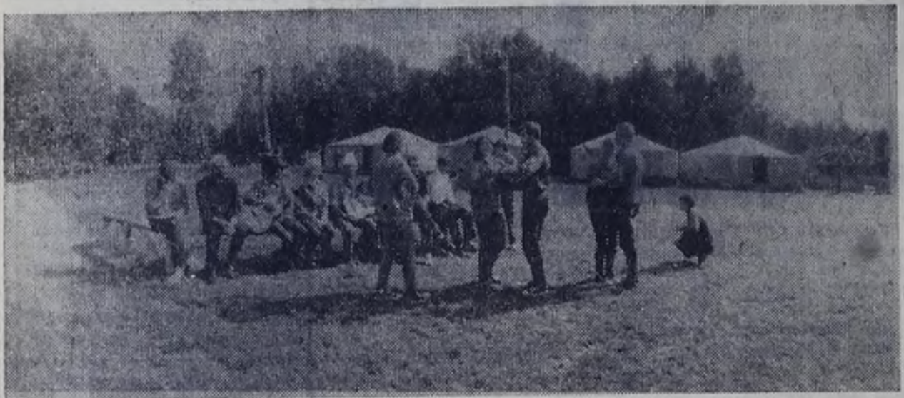
ВОСПОМИНАНИЯ О ЛЕТЕ. РАБОЧИЕ ЗАВОДА ЖБИ-1 НА ОТДЫХЕ.

Спешите приобрести билеты Международной вещевой лотереи солидарности журналистов!