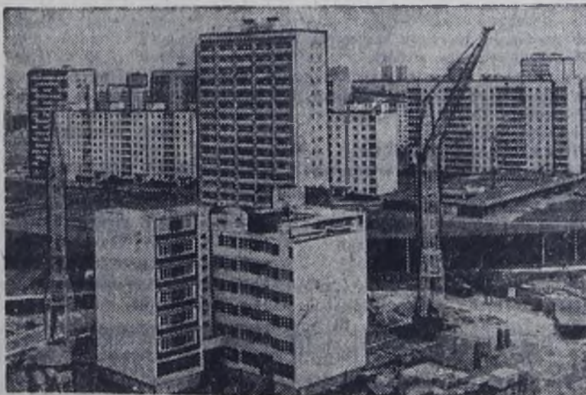
Москва. Строители экспериментального монтажного управления СКБ «Прокатдеталь» возводят в Тропареве новый 22-этажный жилой дом на 147 квартир. Дом оригинальной конструкции — крестообразный в плане — монтируется из унифицированных деталей.

На снимке: строительство экспериментального дома.