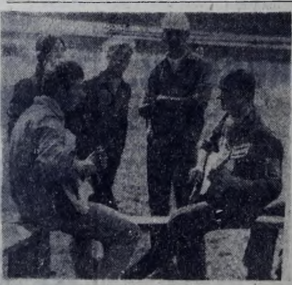
Туристы на привале.