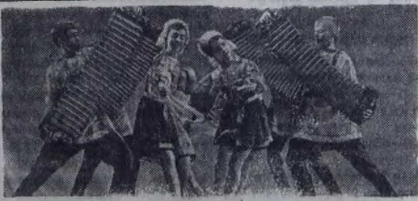
Пионерский ансамбль «Счастливые детство» Дворца культуры Ярославского моторного завода объединяет более трехсот ребят. Выступления юных артистов хорошо знакомы ярославцам — коллективу присвоено звание народного.