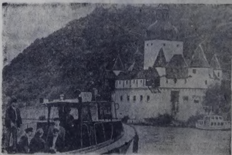
ФЕДЕРАТИВНАЯ РЕСПУБЛИКА ГЕРМАНИИ. Лоцманский катер на Рейне в районе Кауба. На втором плане — старинный замок «Пфальц».