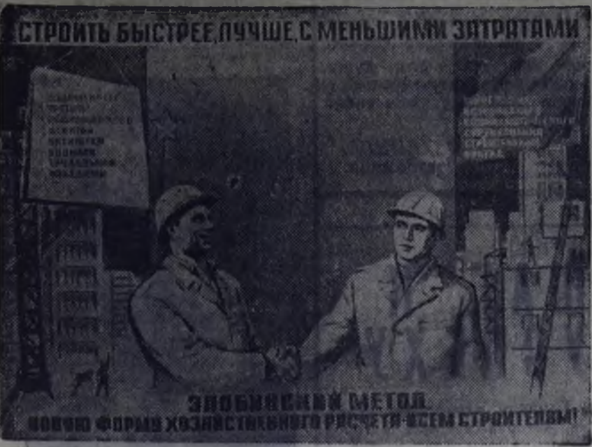
Плакат художника К. Кузгянова. (Издательство «Изобразительное искусство»).