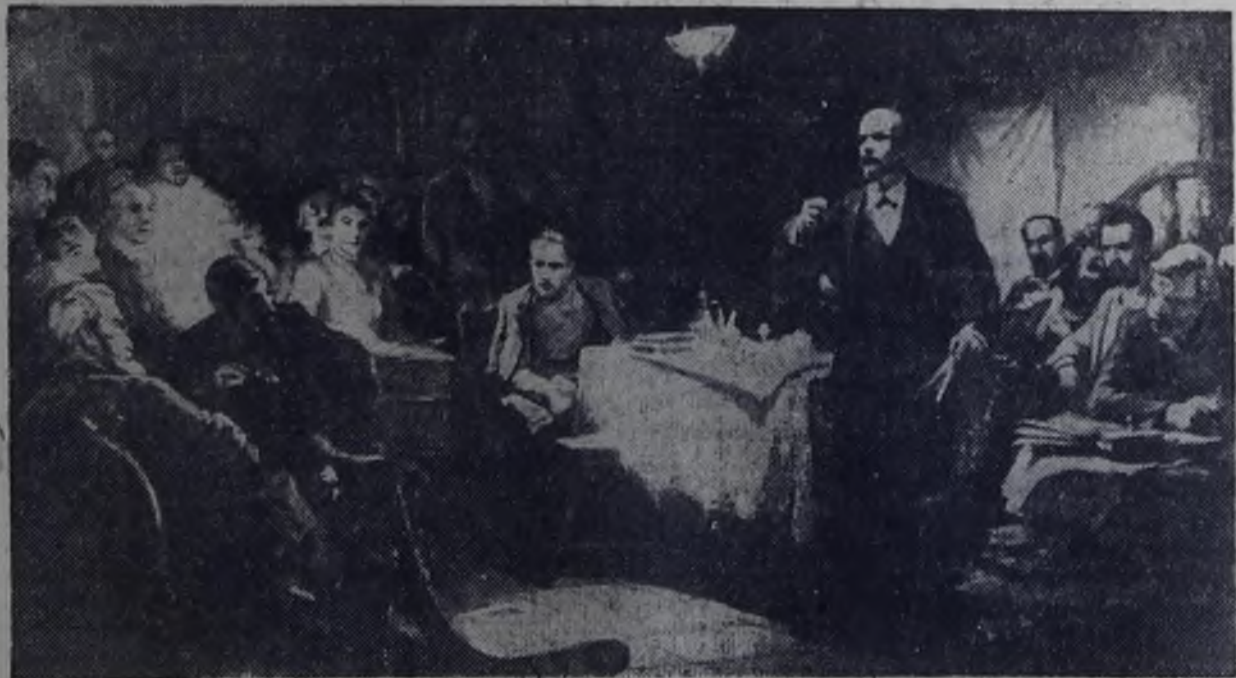
«В. И. Ленин выступает на II съезде РСДРП».

30 ИЮЛЯ — 70 ЛЕТ СО ДНЯ ОТКРЫТИЯ (1903 ГОД) II СЪЕЗДА РСДРП