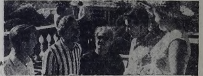
Теплая ясная погода стоит на Черноморском побережье Кавказа. Сочинские санатории, пансионаты и дома отдыха гостеприимно принимают трудящихся, приезжающих сюда со всех концов страны. На снимке: в санатории имени Орджоникидзе.