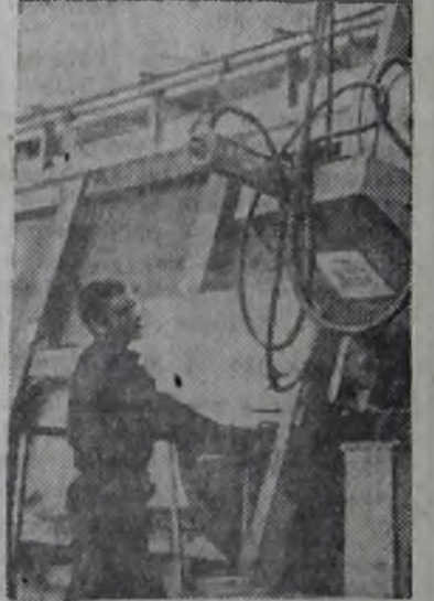
МОСКВА. На Бескудниковском комбинате строительных материалов и конструкций № 1 пущена в эксплуатацию мощная конвейерная линия по производству панелей для строительства новых жилых домов столицы. Ее производительность — 126000 кубических метров наружных стеновых панелей в год.

На снимке: окончательная отделка панелей перед отправкой изделий на строительные площадки Москвы.