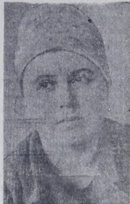
В социалистическом соревновании на заводе.

Энергией таких людей цех постоянно занимает призовые места