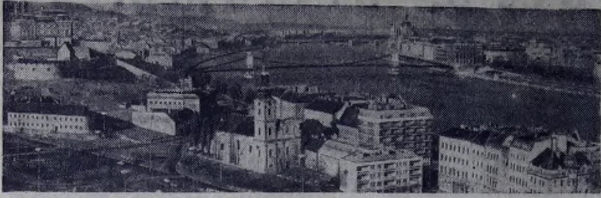
Будапешт — столица Венгерской Народной Республики.