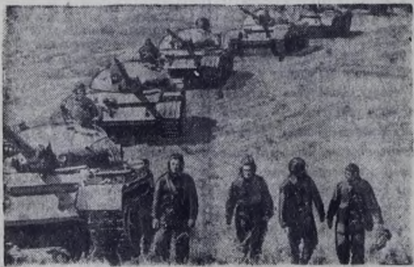
На снимке: танксты на учебных занятиях.

Вчера советский народ торжественно отметил 55-ю годовщину Советской Армии и Военно-Морского Флота.