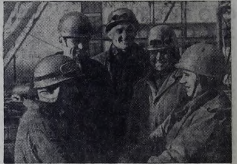
В СТОЛИЦЕ УКРАИНЫ сооружается крупнейший в стране комплекс передающей телевизионной станции. Разработку проекта телебашни и способов ее возведения осуществляли коллективы государственного проектного института «Укрпроектстальконструкция» и института электросварки имени Е. О. Патона АН УССР.

Новый телецентр начнет действовать в первом квартале будущего, 1973 года.