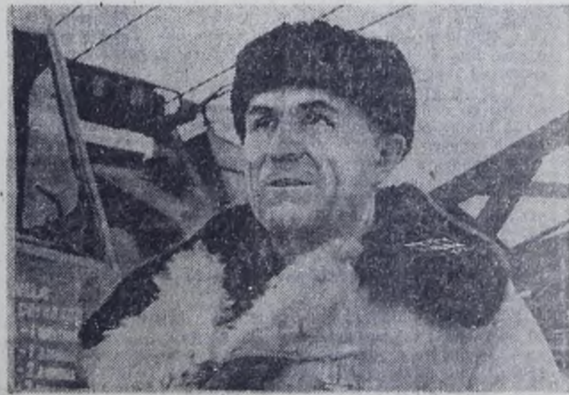
Ширится социалистическое соревнование за досрочное выполнение заданий в третьем, решающем году пятилетки.

Социалистические обязательства обсуждены и приняты на общем собрании рабочих, ИТР и служащих ДОКа-2.