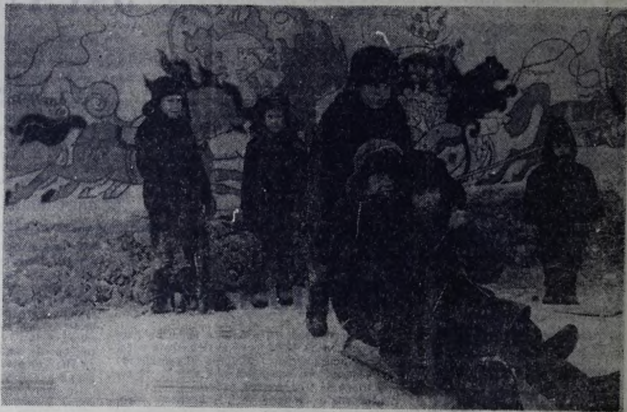
Окончились каникулы, а главная горка у городской елки по-прежнему влечет к себе ребят.