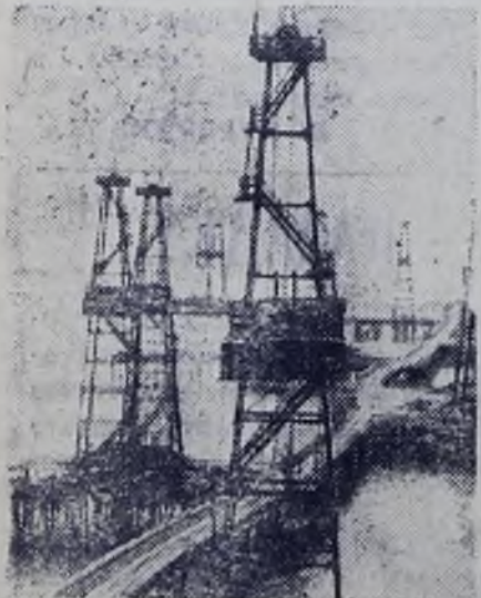
АЗЕРБАЙДЖАНСКАЯ ССР. На сотни километров протянулись над Каспием эстакады морских нефтепромыслов. На снимке — надводная улица нефтегазодобывающего управления имени Серебрянского.

Верность этому великому братству, скрепленному кровью двадцати шести, трудовой Баку доказывал не раз. Рабочую семью его сегодня составляют представители более 90 национальностей, и это действительно одна семья, большая, дружная, монолитно сплоченная — неотъемлемая составная часть той новой исторической общности людей, которая носит простое и гордое имя: советский народ.