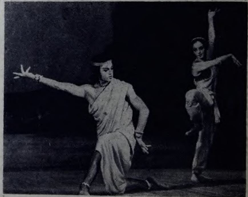
АЗЕРБАЙДЖАНСКАЯ ССР. Постановку балета «Читра» по поэтической драме «Читракада» Рабиндраната Тагора осуществил коллектив Государственного академического театра оперы и балета имени М. Ф. Ахундова. Это лиричная хореографическая поэма о большой любви.

Более 7 тысяч библиотек, 2 тысячи клубов, 40 музеев, более 1900 киноустановок действуют сейчас в Азербайджане.