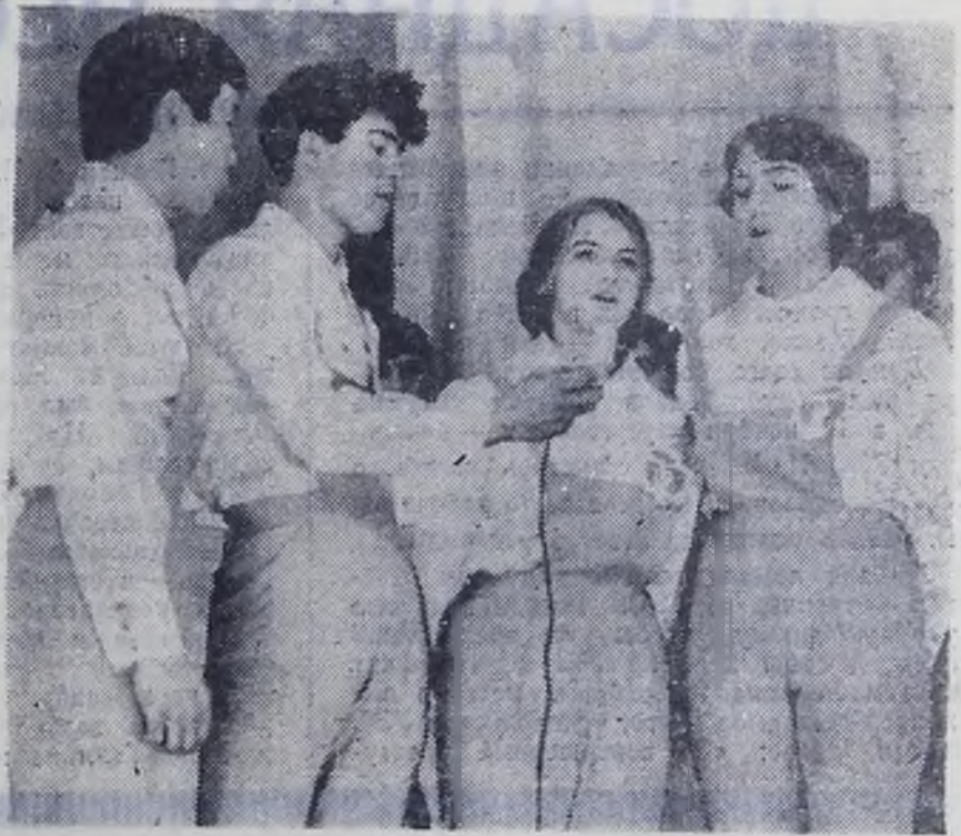
Веселый КВН стал любимым развлечением учащихся ГПТУ-12.