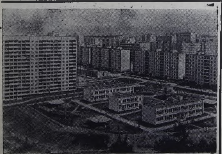
Гагаринский район Москвы — один из самых новых в столице. В него входят жилые кварталы Юго-Запада, Тропарева, Матвеевского.