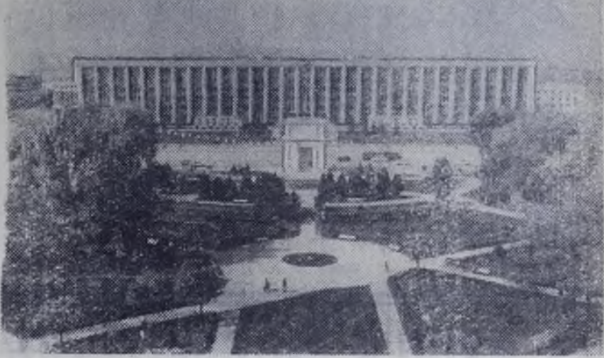
Столица Молдавии — Кишинев. Площадь Победы.

К 1975 году валовое производство винограда в Молдавии намечено довести до 1700 тысяч тонн, а фруктов — до миллиона тонн.