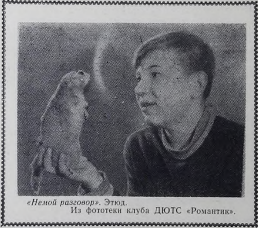
«Немой разговор». Этюд.

Обращаться по адресу: пос. Восточный, дом 18, телефоны: 53-17, 80-43. Часы работы — с 9 до 18.