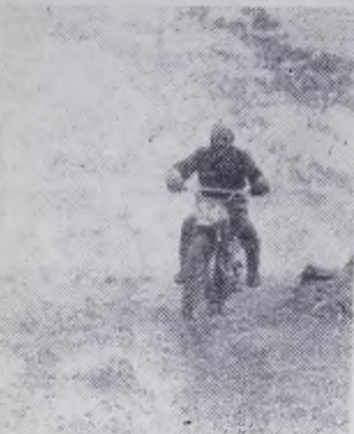
...и на суше.

В праздничный день хочется вспомнить имена наших ветеранов спорта — строителей, тех, кто уже закончил выступления на беговых дорожках, лыжных трассах, сошел с борцовых ковров. Но эти люди не расстались со спортом. Они всегда здоровы, мускулисты, физически крепки, жизнерадостны, словом, — оптимисты.