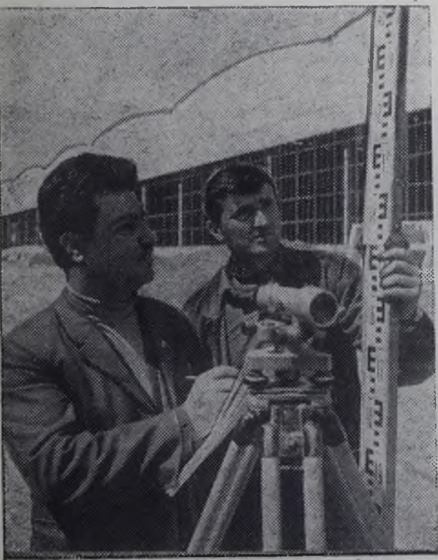
Азербайджанская ССР. В районном центре Агдаме строится большая завод слесарно-монтажного инструмента. Его главный корпус уже возведен.