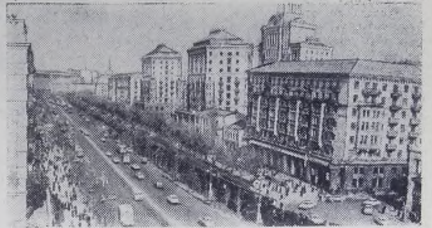
Киев — столица Украины. Центральная магистраль города — Крещатик.

В художественной самодеятельности принимает участие 3,5 миллиона человек. 656 театров, ансамблей, хоров носят звание народных, 44 — заслуженных самодеятельных коллективов. Все они демонстрируют свое искусство на республиканском фестивале, посвященном 50-летию образования СССР.