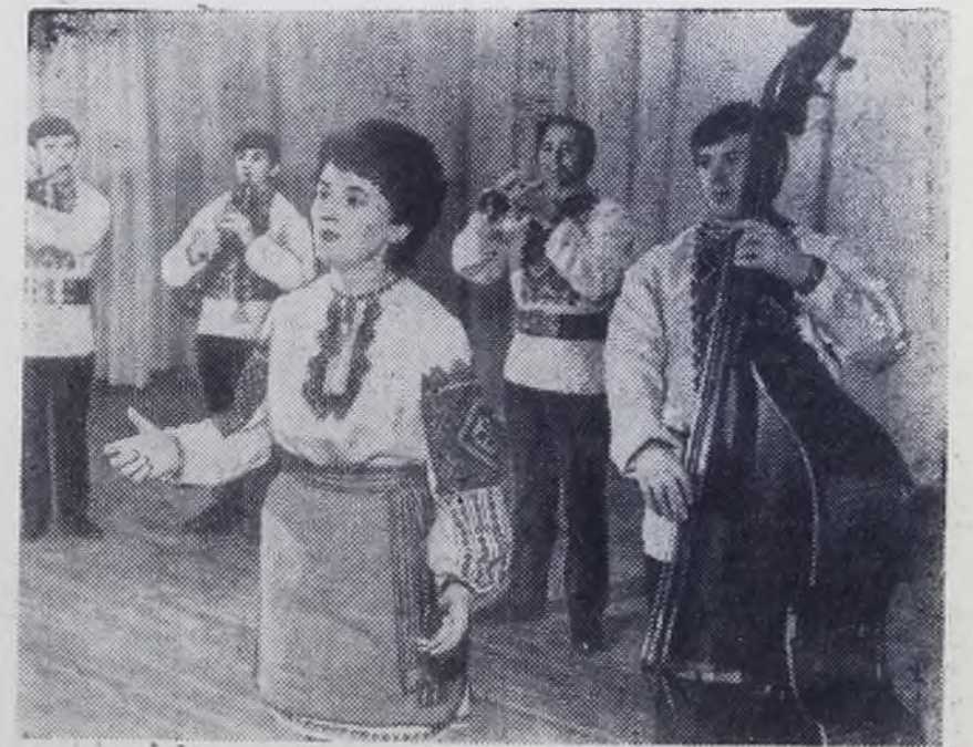
Около 150 рабочих и инженеров комбината «Прикарпатлес» (Ивано-Франковская область) участвуют в самодеятельном народном ансамбле песни и танца «Карпаты». Красочные костюмы, темперамент и мастерство исполнителей завоевали ансамблю любовь зрителей.

К. Мышляев, корр. ТАСС Таращанский район Киевской области