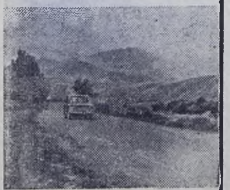
УЗБЕКСКАЯ ССР. Вид на отроги западного Тянь-Шаня.