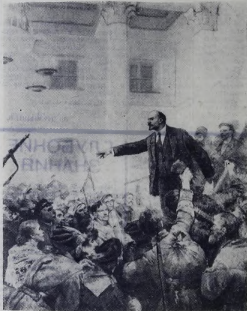
«Ленин провозглашает Советскую власть». Художник В. Серов.