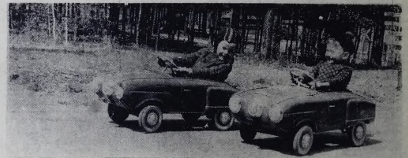
КТО ПЕРВЫМ ПРИДЕТ К ФИНИШУ?

играть во дворе в лапту, другое находится в спортивном коллективе, заниматься физической культурой и спортом под руководством квалифицированных тренеров. В спортклубе ребята имеют богатые возможности тренироваться. Лыжи, бокс, тяжелая и легкая атлетика, борьба, коньки — выбирай по вкусу. Осенью к нам приходят нескладные, угловатые девочки и мальчики. А посмотрите на них через год-два. Стройные, крепкие, с хорошо развитыми мышцами. Для тренировок и соревнований мы пользуемся легкоатлетическим манежем, залами борьбы, бокса, штанги, большим и малым игровыми залами.