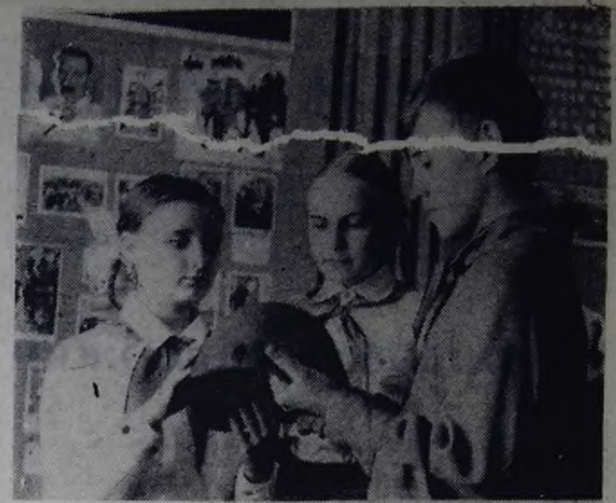
Музей боевой славы во Дворце пионеров пользуется большой любовью среди ангарских школьников. Они приходят сюда посмотреть документы о подвигах героев, послушать рассказы бывших воинов.

На снимке: эта каска принадлежит безымянному защитнику Севастополя.