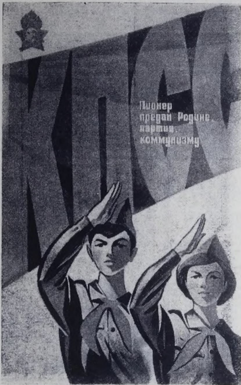
19 МАЯ — 50 ЛЕТ ВСЕСОЮЗНОЙ ПИОНЕРСКОЙ ОРГАНИЗАЦИИ ИМЕНИ В. И. ЛЕНИНА