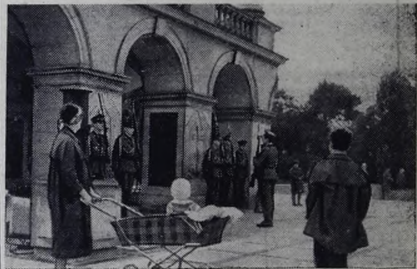
ВАРШАВА. Могила Неизвестного солдата на площади Победы. Смена почетного караула.

В моих руках натруженных поет рубанок радостно, От золотого кружева сосновой вьет сладостью. Я столяр по призванию, поэт — по вдохновению. Мне жизнь дала задание — учиться жить по Ленину. И с каждой песней новою Моя душа не старится. Душистая, сосновая — Вот эта жизнь мне нравится!