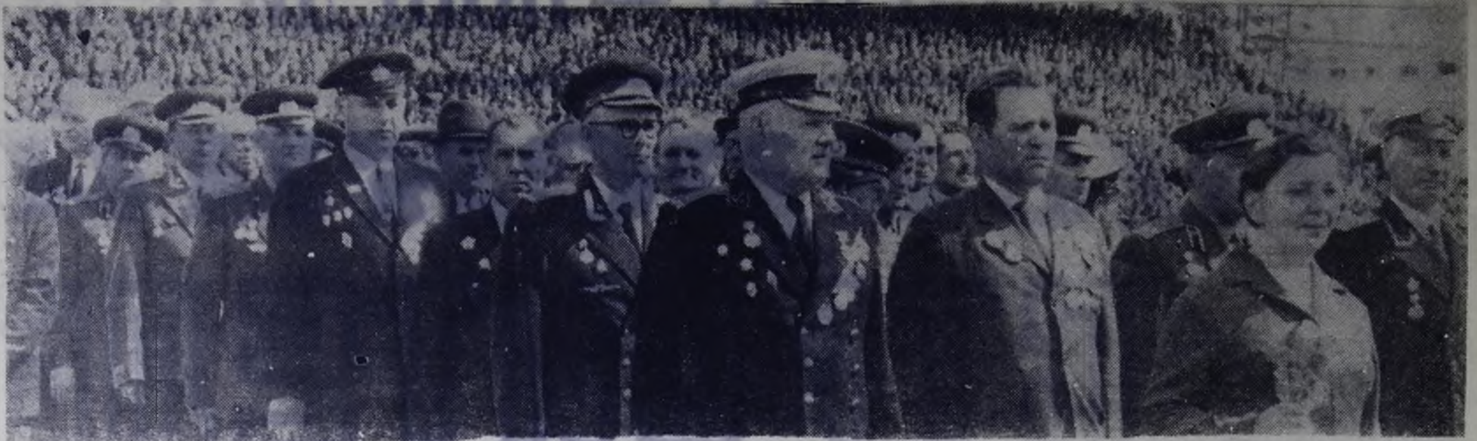
ШАГАЮТ ГЕРОИ СРАЖЕНИЙ.