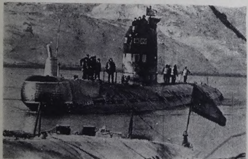
ВОЕННЫЕ МОРЯКИ В ДАЛЬНИХ ПОХОДАХ, ТРОПИКАХ И ЗАПОЛЯРНОЙ СТОЙКО И МУЖЕСТВЕННО ПРЕОДОЛЕВАЮТ ОКЕАНСКИЕ СТИХИИ. ОНИ ВСЕГДА ГОТОВЫ ВЫПОЛНИТЬ ПРИКАЗ РОДИНЫ.