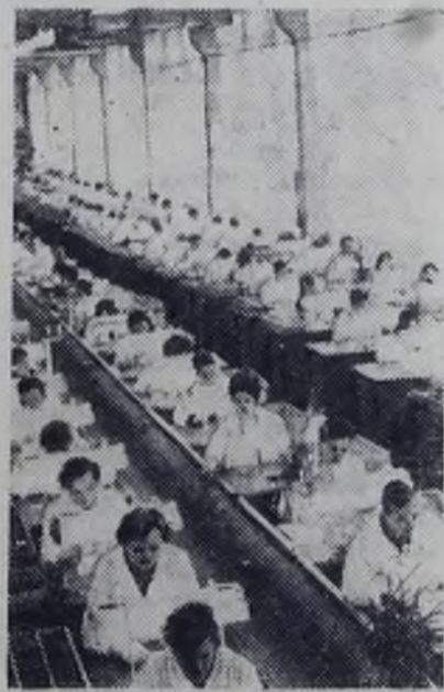
СОЗВЕЗДИЕ БРАТСКИХ РЕСПУБЛИК

Рижский ордена Ленина завод ВЭФ имени Ленина — одно из крупнейших предприятий электротехнической промышленности Советского Союза. Автоматические телефонные и телеграфные станции, телефонные аппараты, транзисторные радиоприемники, изготавливаемые здесь, заслужили добрую славу у нас в стране и за рубежом.