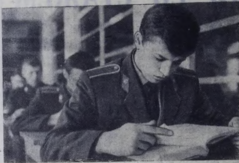
Омск. Пятьдесят лет назад в Омске была открыта школа милиции.

Учебный комбинат строительства производит набор на курсы с отрывом от производства по специальности слесарь по ремонту строительных машин. Принимаются отслужившие в армии, с образованием 8 классов. Срок обучения 4 месяца, стипендия 65 рублей в месяц. Обращаться по адресу: поселок Восточный, дом 18, телефоны 80-43, 55-60, 53-17.