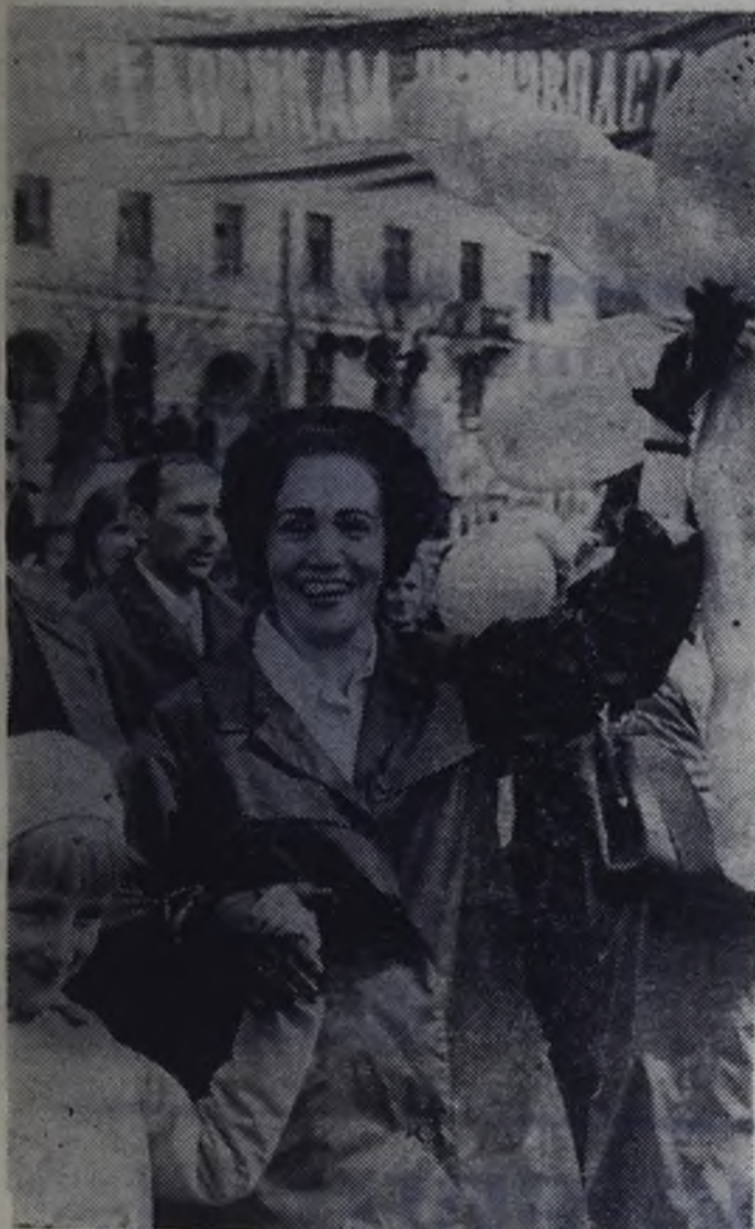
Ангарск. На площади имени Ленина.

Задержалась нынче зима, и праздничное утро 7 ноября выдалось в нашем городе ясным и солнечным. Тысячи ангарчан вышли на улицы и площади, чтобы принять участие в демонстрации, которая посвящалась дню рождения Советской власти. В 54-й раз праздновали мы этот день, и праздник наш никогда не стареет, как вечно молодой остается Родина Октября, идущая уверенной поступью к вершинам коммунизма.