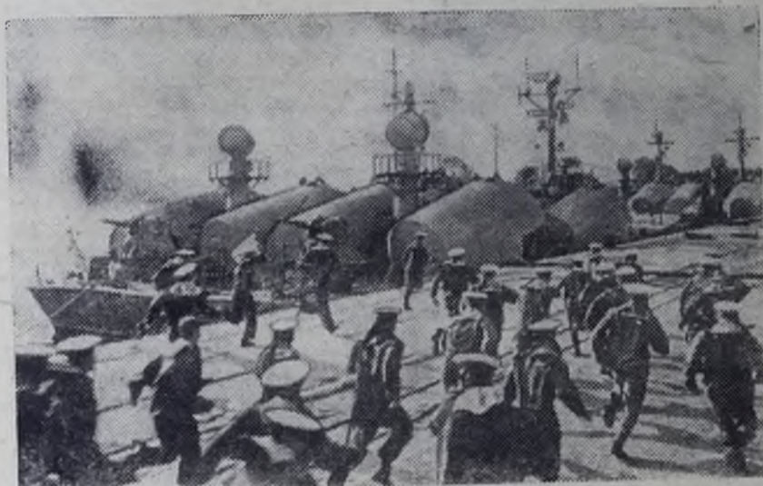
На страже морских рубежей

М. ВОЛКОВА, инженер по технике безопасности горгаза.