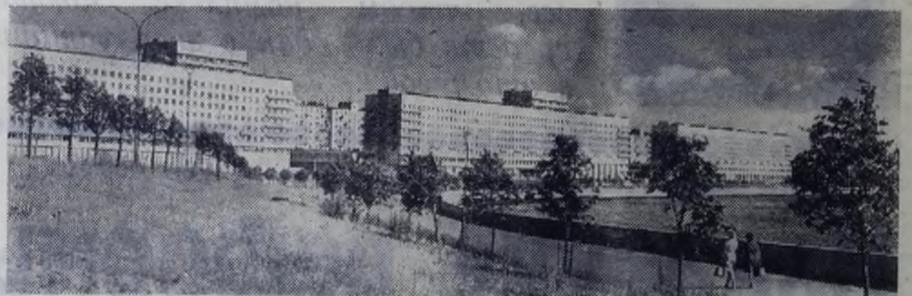
Новостройки Ленинграда на Свердловской набережной.