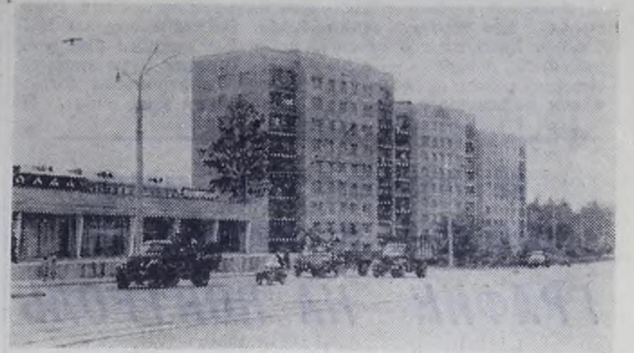
Ангарск, улица Чайковского.