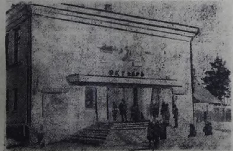
На снимке: кинотеатр «Октябрь», один из старейших в городе.