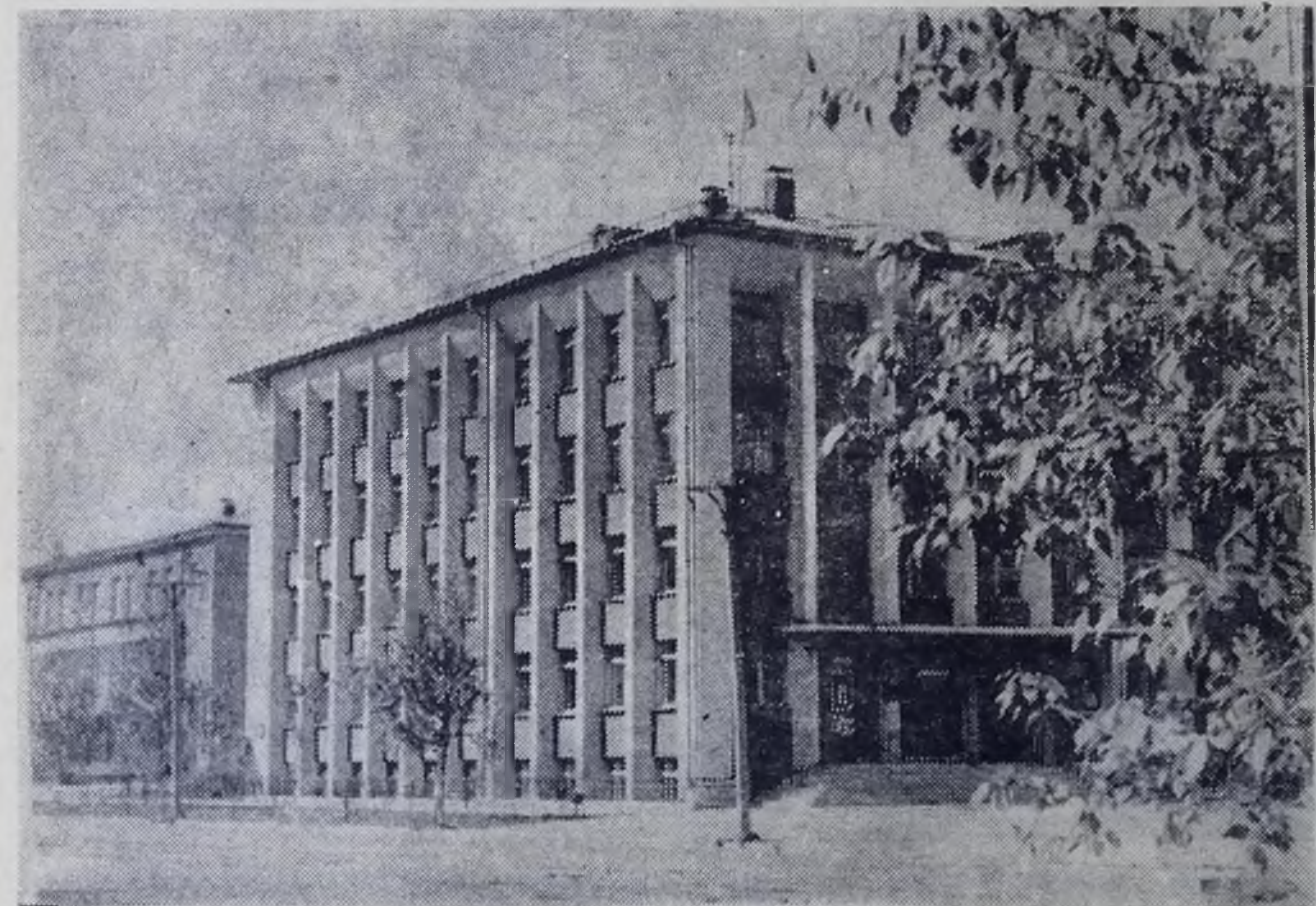
Лучшие свои сооружения ангарские строители дарят тем, кто готовится принять эстафету от старшего поколения. В одном из самых краси-вых зданий нашего города размещается филиал Иркутского политехнического института.