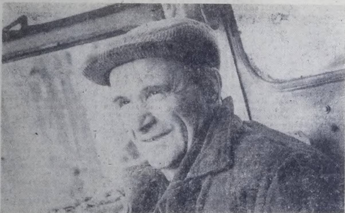
Представляем передовиков пятилетки