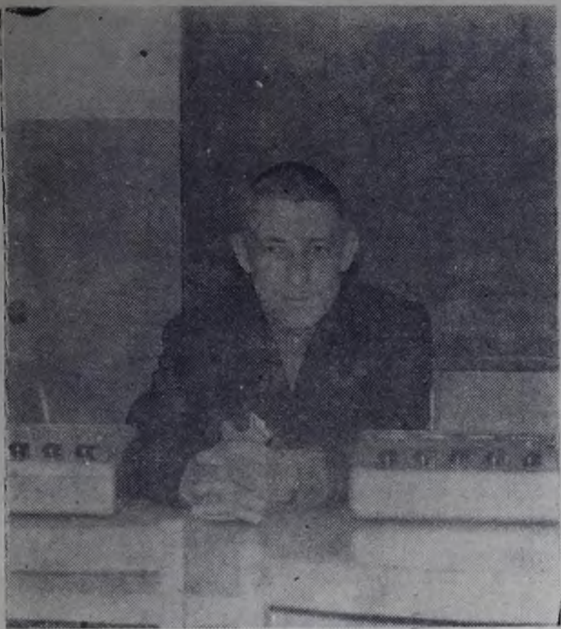
НЕЛЕГОК ИХ ТРУД

За последние годы наша газета много раз писала об учебе строителей в Ангарском промышленном техникуме (в прошлом — филиал Новосибирского строительного техникума). Это учебное заведение готовит кадры руководителей среднего звена, в основном, для подразделений нашей стройки. Мы рассказывали о том, как студенты-вечерники, совмещая учебу с работой на производстве, с высоким напряжением шли к вершинам знаний, постигали науку управлять.