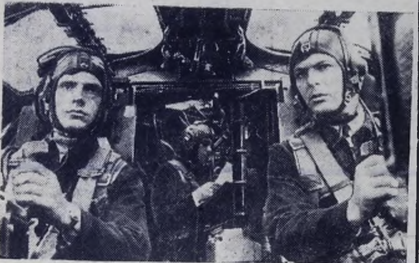
Отличный экипаж самолета в полете.