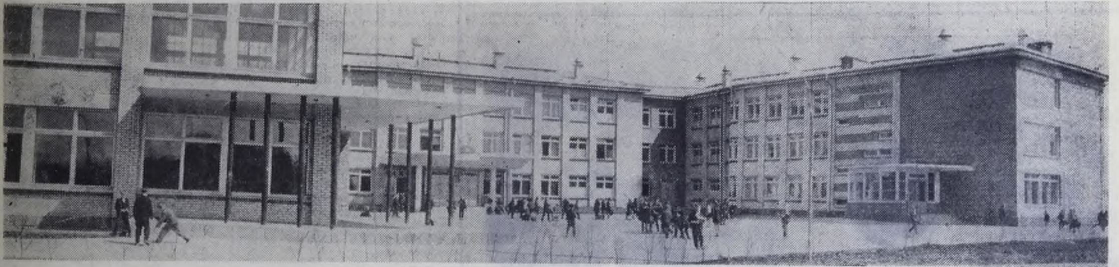
Новая школа в восьмом микрорайоне Ангарска.

Так и собрались в бригаде победители различных конкурсов: 6 человек. В день открытия XXIV съезда КПСС рабочие, которыми руководит Савиченко, в честь такого события дали 60 кубометров