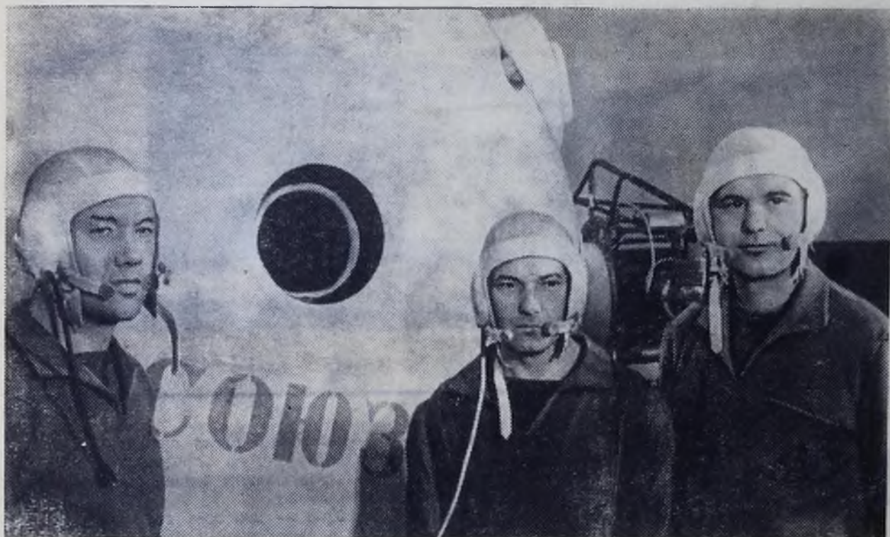
Экипаж космического корабля «Союз-10» (справа налево) — командир космического корабля В. А. Шаталов, инженер-испытатель Н. Н. Рукавишников и борт-инженер А. С. Елисеев.