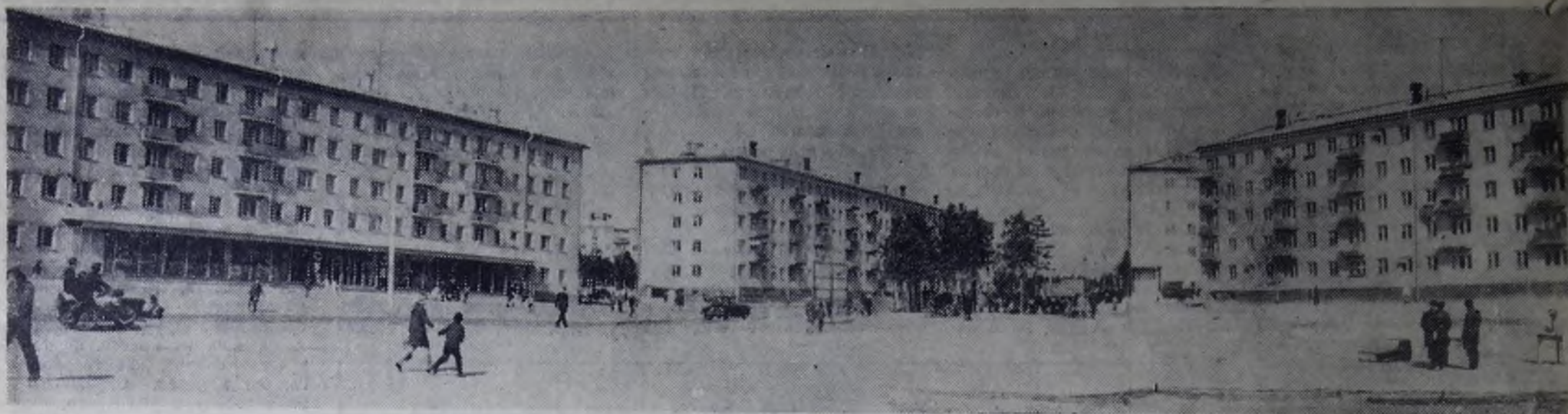
Ангарск. Новые микрорайоны — 11-й и 12-й.