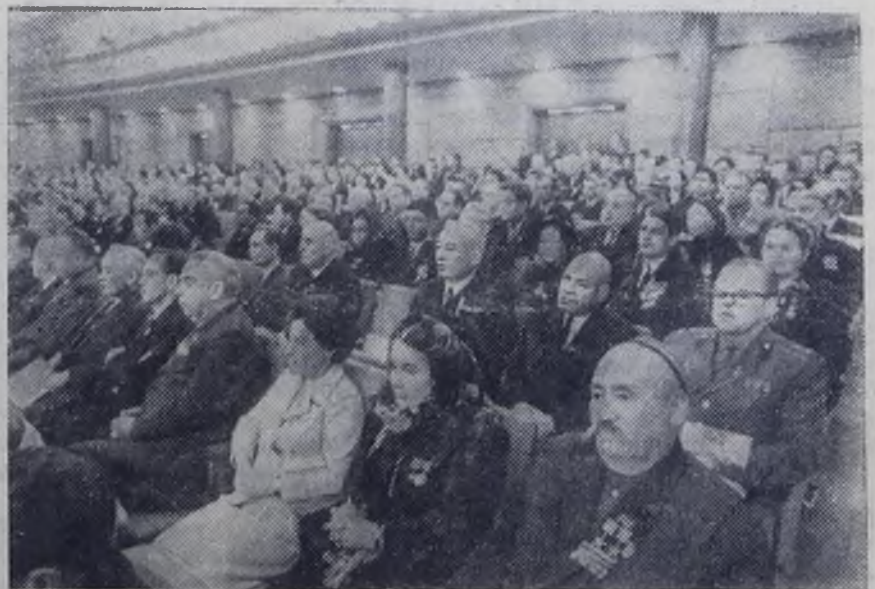
Москва. XXIV съезд КПСС. На снимке: в зале Кремлевского Дворца съездов во время заседания.

Делегаты и гости с большим воодушевлением исполняют партийный гимн «Интернационал».