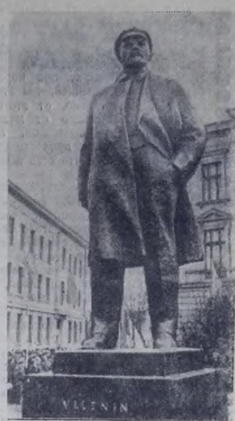
Чехословакия. Памятник Владимиру Ильичу Ленину, открытый на центральной площади в городе Градец-Кралове.