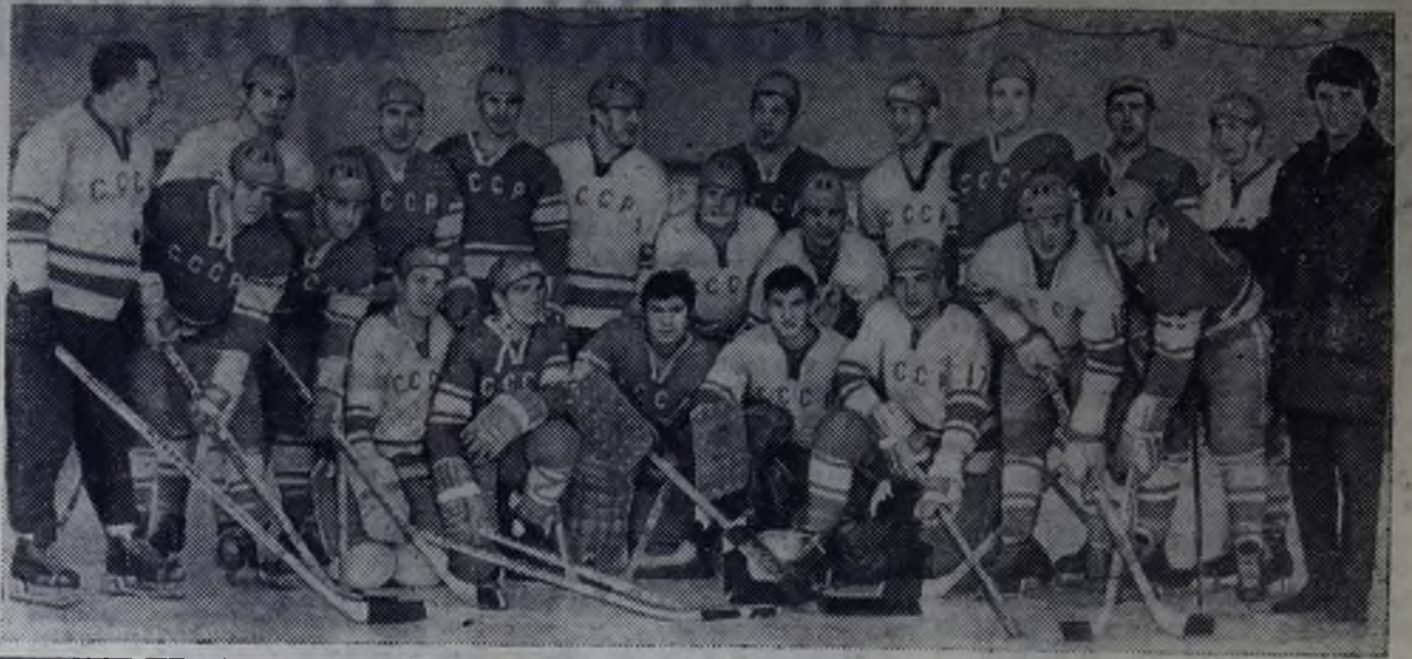
Сборная команда СССР по хоккею с шайбой, чемпион мира 1971 года.

Высокую поэтичность и человечность картины подчеркивают стихи Беллы Ахмадулиной в авторском исполнении. В одном из эпизодов поэтесса говорит: «В спорте выражается все лучшее, что в человеке есть: его детская непринужденность, стремление к бескорыстной победе не в ущерб другим людям».