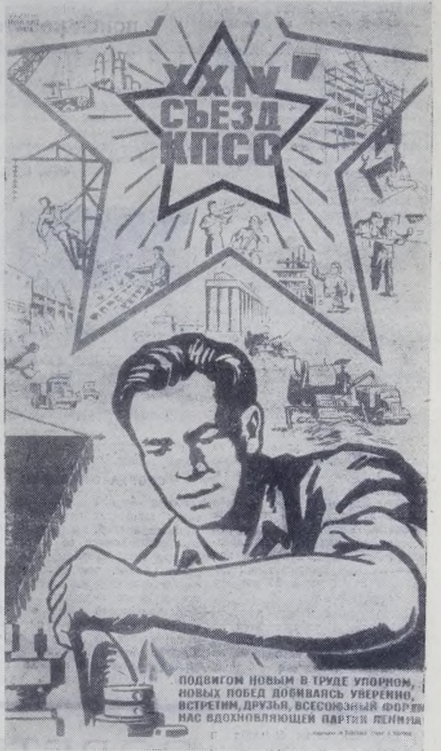
ПОДВИГОМ НОВЫМ В ТРУДЕ УПОРНОМ, НОВЫХ ПОБЕД ДОБИВАЯСЬ УВЕРЕННО, ВСТРЕТИМ, ДРУЗЬЯ, ВСЕСОЮЗНЫЙ ФОРУМ НАС ВОДОХВОЛЯЮЩЕЙ ПАРТИИ ЛЕНИНА