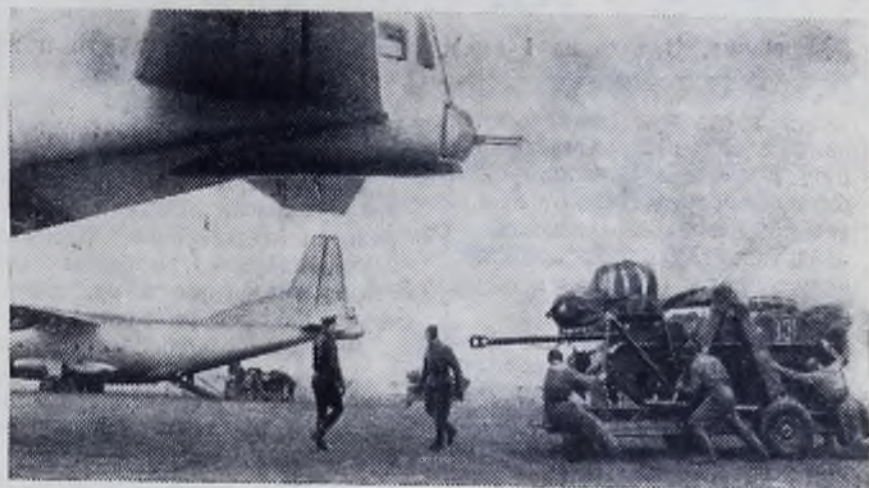
На учениях — воздушная пехота.