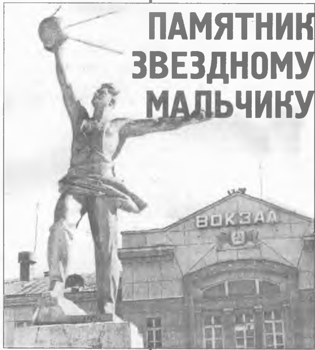
ПАМЯТНИК ЗВЕЗДНОМУ МАЛЬЧИКУ

Под строгим секретом до сих пор находятся приборы, которые для космических исследований выпускает ОКБА. Они используются для измерения влажности и концентрации кислорода на космодромах и зондах, контролирующих атмосферу. Аналогов их нет в России. И не только. Ангарские специалисты и сейчас курируют работу своей техники в Индии. Индийцы ведь тоже мечтают о космосе, нет-нет, да и запустят ракету-другую, а наши им в этом нелегком деле помогают.