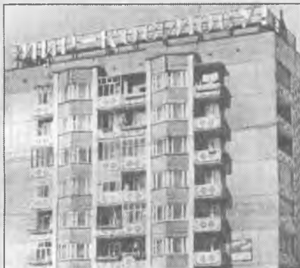
Из той же оперы. Улица Космонавтов и лозунг "Мир космосу!"