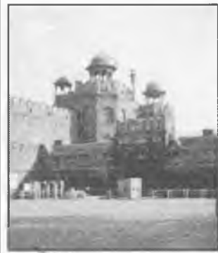
Один из многочисленных дворцов столицы

Самое главное, что я поняла в этой поездке, - надо обязательно верить в лучшее, не раздражаться по пустякам и жить сердцем. И тогда все получится. Появятся деньги, появится время и все сложится так, что у вас не будет шансов не поехать в Индию. А мечты, загаданные в стране-сказке, обязательно сбываются.