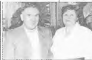
И все-таки они были первыми.

Таковыми вот разными оказались две "Свадьбы - 2001". В основе одной лежат юношеские эмоции, "за плечами" у другой - прожитая жизнь и житейская мудрость. Но обе можно считать первыми в этом году. Разве такой расклад не является глубоко символическим?