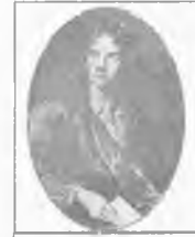
Жан Батист МОЛЬЕР