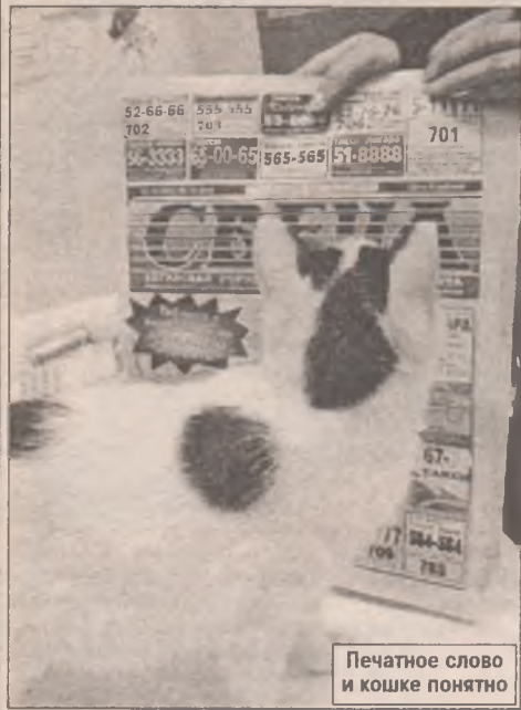
Печатное слово и кошке понятно

Любимой газете не изменяют. Как-то не принято. Своего читателя не огорчают. И мы стараемся. И будем стараться, чтобы вас было еще больше. Тех, кто скажет: "Слушай, я вчера прочитал в "Свече"... Хотя мы не доллары, чтобы нравиться всем.