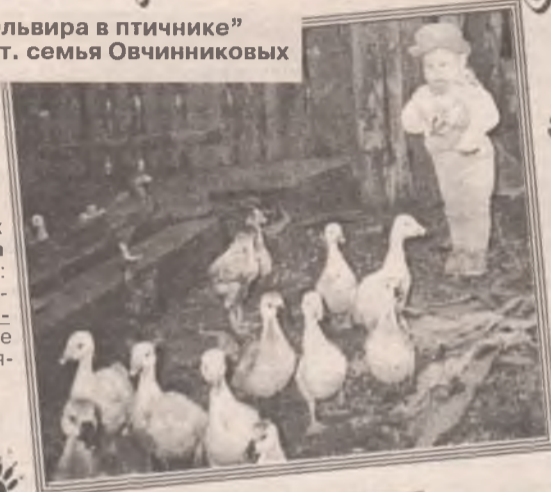
"Эльвира в птичнике" Авт. семья Овчинниковых