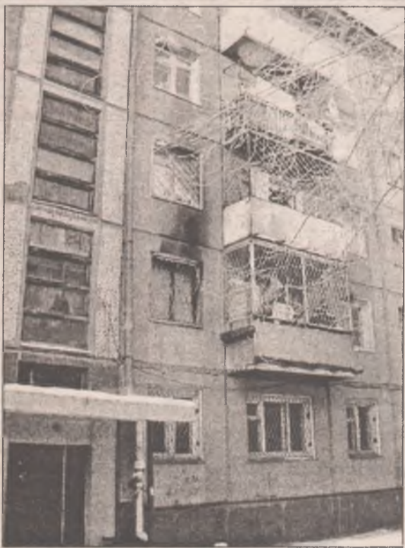
Продолжение. Начало в № 20

Сможет ли самосуд над наркоторговцами решить проблему?