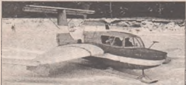
Окончание. Начало на 1 стр.