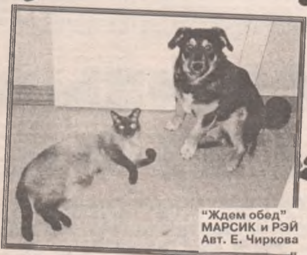
"Ждем обед" МАРСИК и РЭЙ Авт. Е. Чиркова