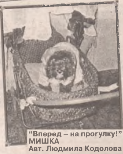
"Вперед – на прогулку!" МИШКА Авт. Людмила Кодолова