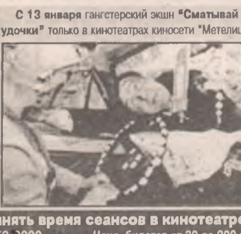
С 13 января гангстерский экшн "Смазьвай удочки" только в кинотеатрах киносети "Метелица"