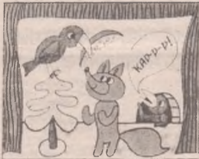
1. Золотой ключик?