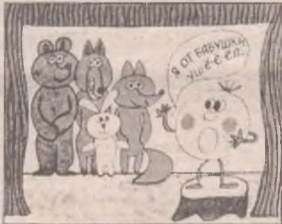
2. Три поросенка?