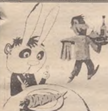
— Надо было выбрать другую маску...

Эта история произошла со мной в одном из поселков Усольского района в последний вечер старого года. Решил я Новый год встретить по-холостяцки. Все было как обычно: переливался всеми цветами ра-