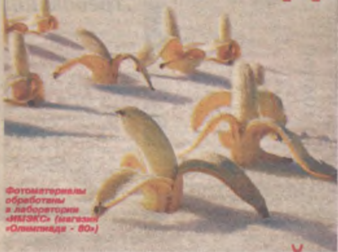
Фотоматериалы обработаны в лаборатории «ИИЗКС» (магазин «Олимпиада - 80»)

Рано в этом году появились подснежники. Но вот что удивительно, что-то не так в этих цветах. То ли необычный пестик, то ли тычинки, да и на вкус они почему-то хороши. Эти цветы были обнаружены в пойме Китая совсем недавно, но ангарские цветоводы уже заинтересовались находкой. Ведь полагается возможность совместить полезное с приятным. К примеру, вы покупаете подруге цветы, соответственно оформленные, дарите, а затем вместе поедаете эти подснежники. Так что по всем вопросам обращайтесь в цветочные магазины города. Андрей Андриенко.