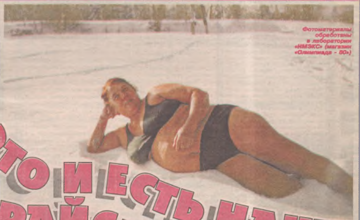
Фотоматериалы обработаны в лаборатории «ИМЭКС» (магазин «Олимпиада - 80»)