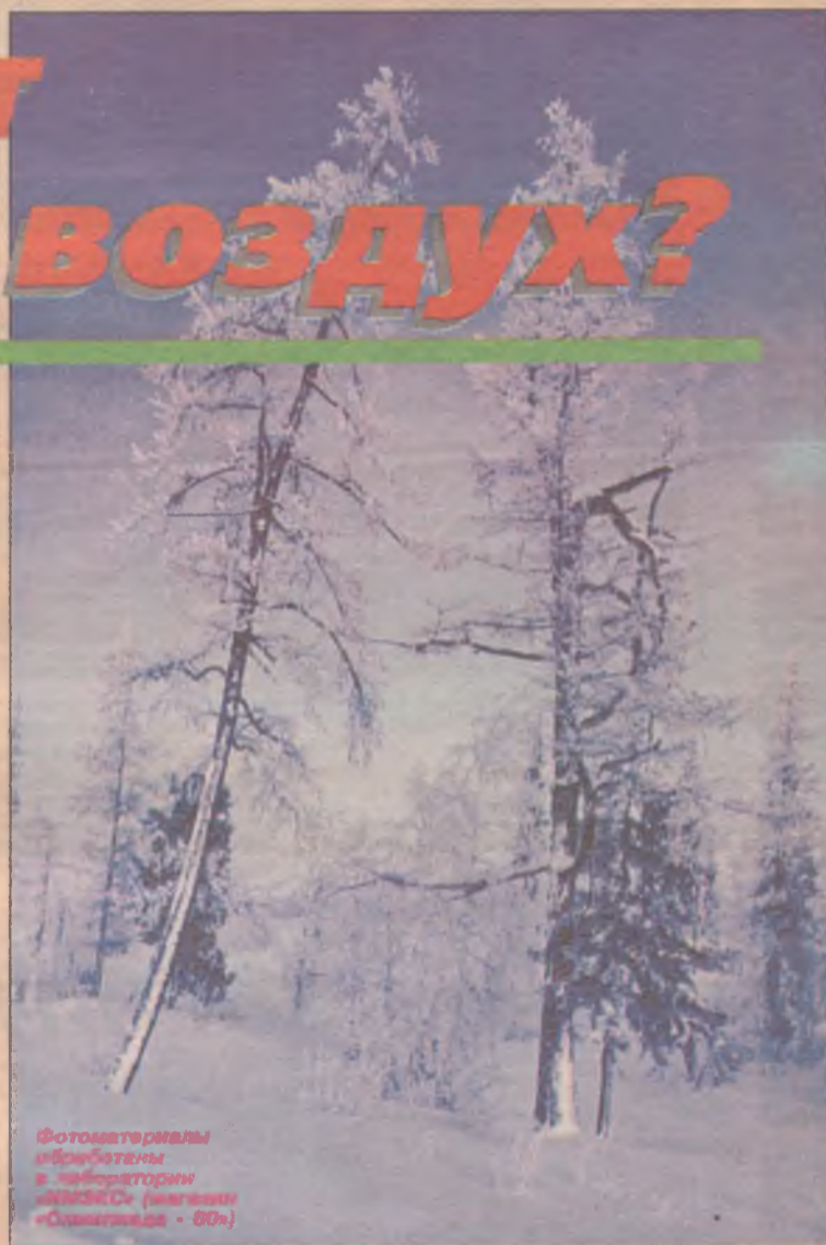
Фотоматериалы обработаны в лаборатории «ОЛЫХОНА» (магазин «Олимпиада - 80»)

Если же таковых в семье не имеется, квартира малогабаритная и лыжи вам нужны 3 раза в году, проще брать их напрокат. С прискорбием вынуждена сообщить, что памятная лыжная база в 95-м квартале давно приказала долго жить. Единственное место в городе, где можно за 2,5-3 тысячи в час покататься на чужих лыжах — это лыжная база АЭХК в 189 квартале (в пристройке к спортзалу МЖК). Лыжи там выдают под залог паспорта, пластиковые чуть дороже, деревянные чуть дешевле. Для школьников, которые ходят сюда на физкультуру, скидка: им час активной вентиляции легких при помощи казенных лыж обходится в 2-2,5 тысячи рублей. Так что можете заранее посчитать, во сколько вам обойдутся зимние уроки физкультуры, если ваше чадо учится в одной из квартальных школ. Если же вы сломаете лыжу, то вам придет-