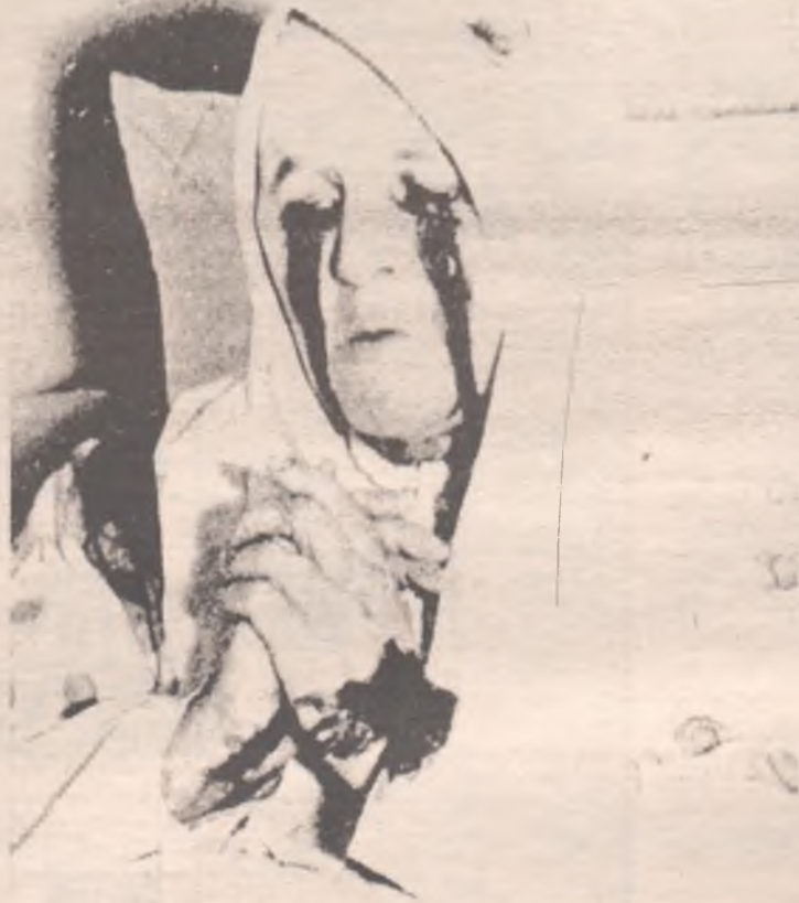
Тереза Ньюманн из Баварии.