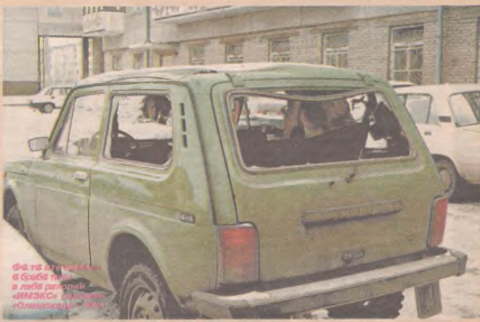
Фотосъемка в Ангарске в ночь взрыва «НИВЫ» в районе «Туборг»