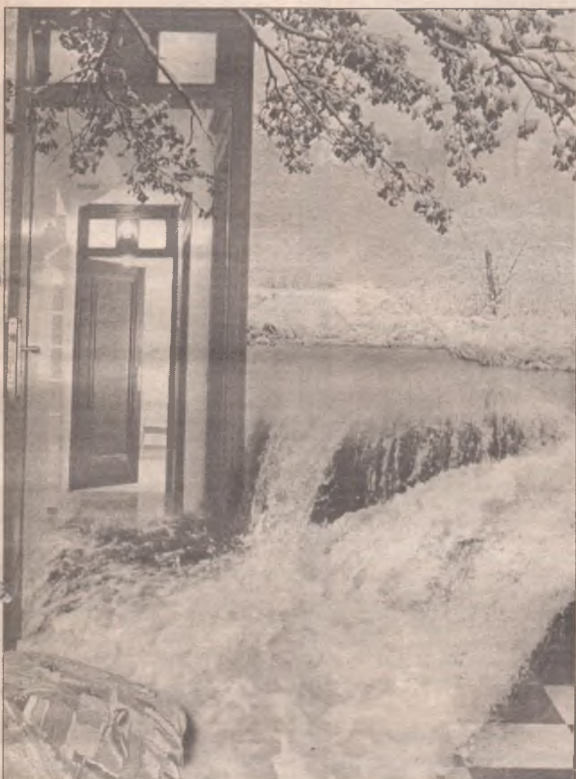
Продолжение. Начало на 1 стр.