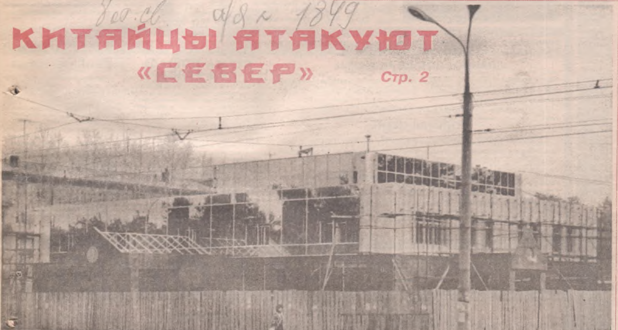
Фотоматериалы обработаны в лаборатории «ИМЭКС» (магазин «Олимпиада - 80»)